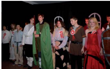
Młodzież występująca w spektaklu

Uczniowie przygotowali inscenizację pt. „Legenda o Popiele i Piaście Kołodziejcu”, a chór szkolny w pieśniach patriotycznych przypomniał okupioną krwią i bólem drogę Polaków do niepodległości. W spotkaniu uczestniczyli proboszczowie gminnych parafii, radni, pracownicy Urzędu Gminy oraz jednostek podlegających, sołtysi, młodzież gimnazjalna oraz zaproszeni goście.