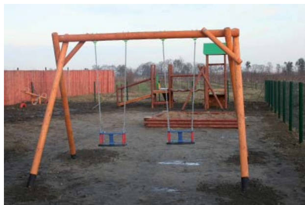
Plac zabaw w Wysokiej

Budowę placów zabaw w Wysokiej i Gołutowie zakończono 7 grudnia 2011 r. Prace wykonało wyłonione w przetargu Przedsiębiorstwo Wielobranżowe „APIS” z Jarosławia. Placówki powstały za sumę 82 400,00 zł.