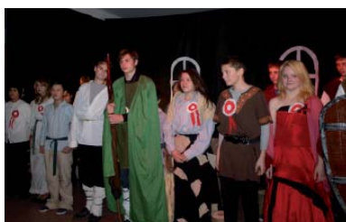
Młodzież występująca w spektaklu

Uczniowie przygotowali inscenizację pt. „Legenda o Popiele i Piaście Kołodziejcu”, a chór szkolny w pieśniach patriotycznych przypomniał okropną krwią i bólem drogę Polaków do niepodległości. W spotkaniu uczestniczyli proboszczowie gminnych parafii, radni, pracownicy Urzędu Gminy oraz jednostek podlegających, sołtysi, młodzież gimnazjalna oraz zaproszeni goście.