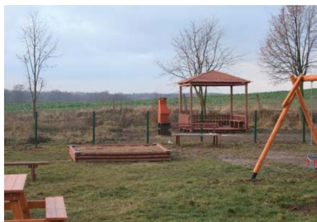
Plac zabaw w Gołutowie