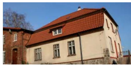
Dach po remoncie

W okresie letnim remontowane były budynki Zespołu Szkół w Rychlikach. Prace budowlane obejmowały swoim zakresem wymianę pokryć dachowych, obróbek blacharskich oraz okien. Remont przeprowadziła wyłoniona z przetargu firma Monster z Olsztyna za sumę 101 118,25 zł.