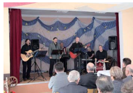
Występ „Chóru Wujów”

Wszystkim, którzy włączyli się w organizację imprezy, serdecznie dziękujemy.