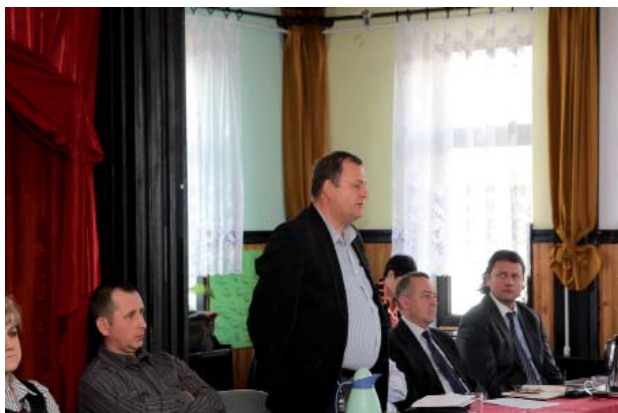
Sesja Rady Gminy