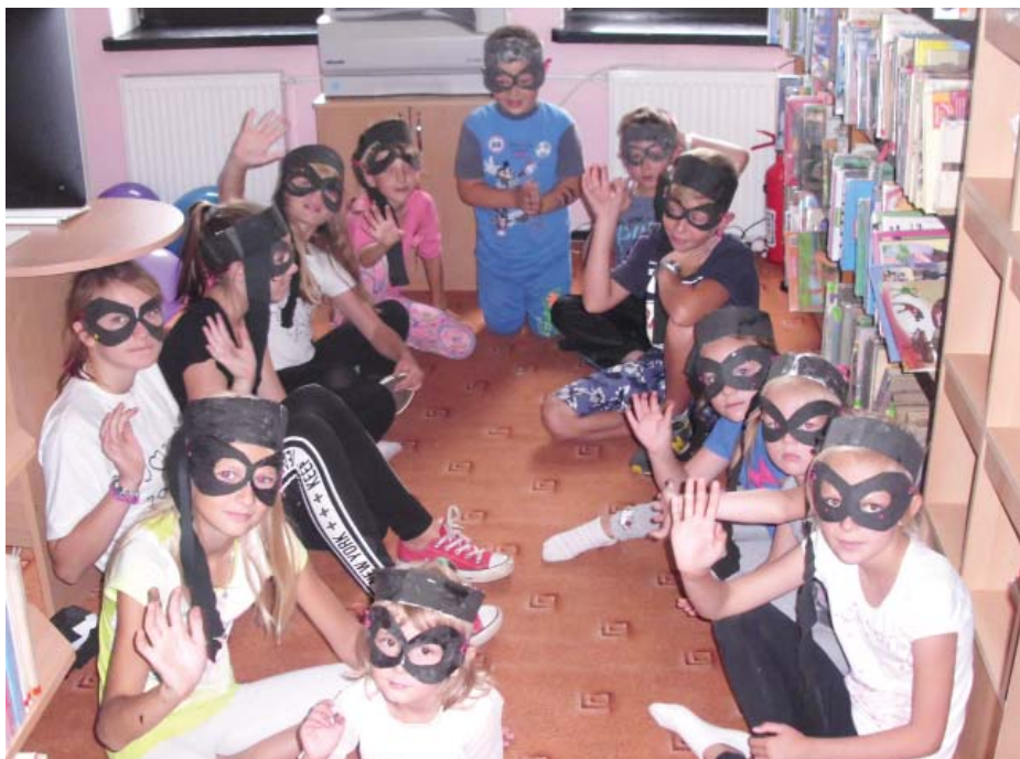
Wakacje w bibliotece