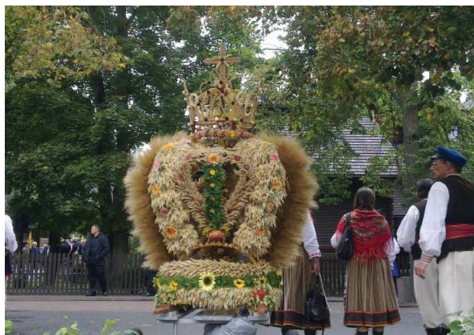
Ludowe dzieło sztuki na dożynkach prezydenckich