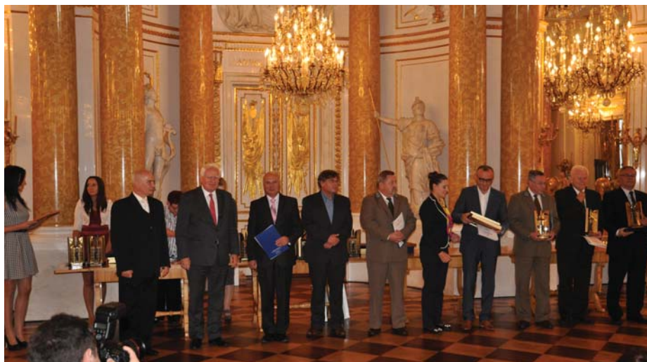
Rozdanie dyplomów na Zamku Królewskim w Warszawie

– Obecność hydroformni w Gołutowie w finale konkursu jest potwierdzeniem naszych decyzji inwestycyjnych. To także sukces, ponieważ do konkursu przystąpiły znacznie większe samorządy i inwestorzy, dysponujący często kilkukrotnie większymi budżetami. Zaangażowanie mieszkańców w głosowaniu internetowym odbieram jako inspirację dla podobnych działań.