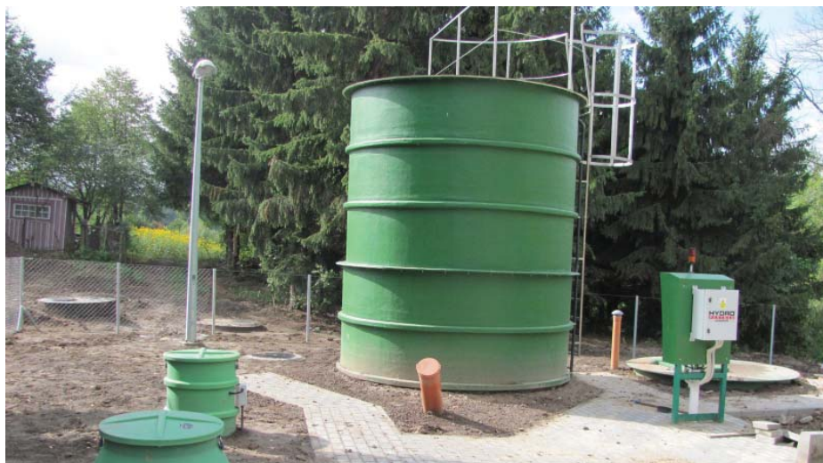
Oczyszczalnia w Powodowie

Wykonawca zakończył już prace przy budowie oczyszczalni oraz sieci wodociągowej w Powodowie. Wójtowi udało się pozyskać 90% dofinansowania na ten cel z Agencji Nieruchomości Rolnych (775 tys. zł). We wrześniu wszyscy mieszkańcy Powodowa zostali przyłączeni zarówno do sieci wodociągowej, jak i kanalizacji sanitarnej.