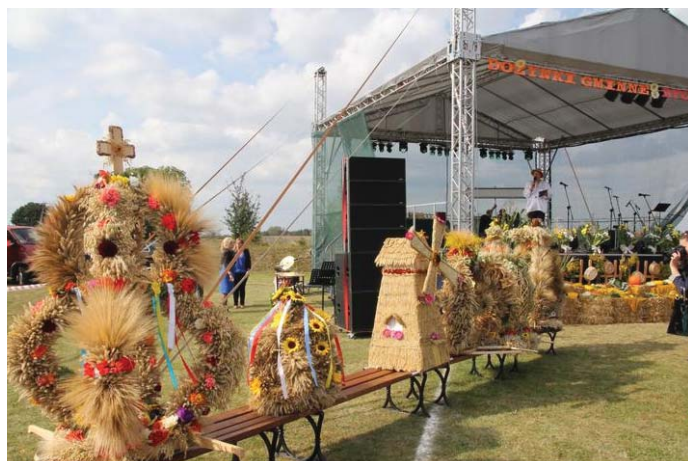
Wieńce dożynkowe

W części artystycznej mieszkańców bawiły: zespół Ostródzianie, kapela Potok i grupa Lotos. Gwiazdą wieczoru był Marcin Siegieńczuk. Serdecznie dziękujemy sołectwom, mieszkańcom gminy za tak liczne zaangażowanie w przygotowanie do imprezy.