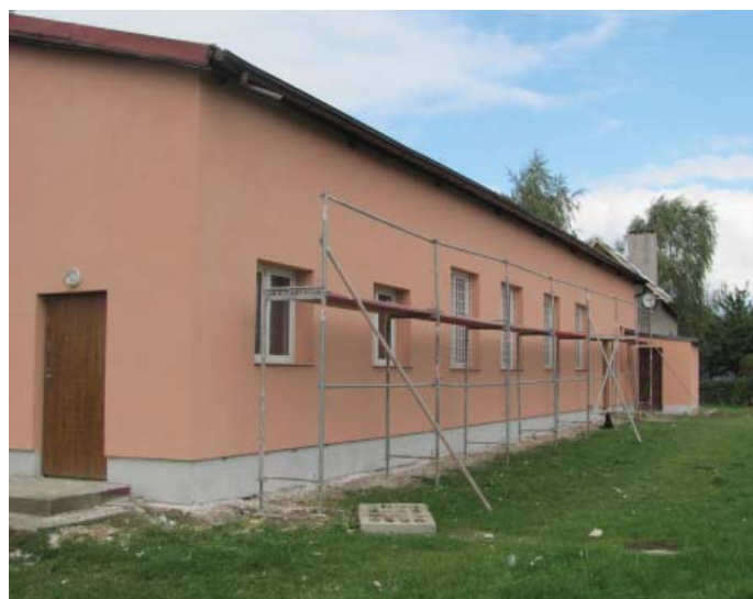
Remont świetlicy w Świętym Gaju

W Jankowie powstaje drewniany domek, który będzie służył mieszkańcom nowego sołectwa jako miejsce spotkań i zebrań wiejskich. Szacowany koszt inwestycji to 80 tys. zł.