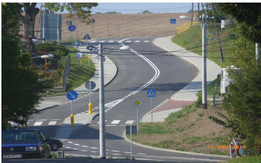
Droga 527 po remoncie

Kierowcy mogą już w pełni korzystać z odnowionej drogi. Jej nawierzchnia została rozebrana i wybudowana na nowo. Dziś jest to droga o dużo większej wytrzymałości na obciążenia samochodów ciężarowych.