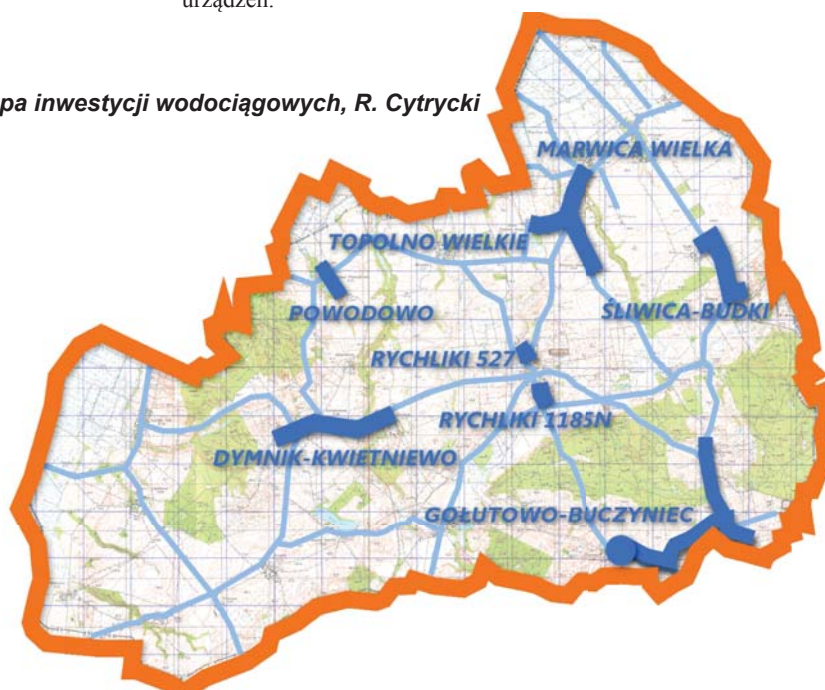
Mapa inwestycji wodociągowych, R. Cytrycki

We wrześniu Gminny Zakład Komunalny podpisał umowę z firmą Hydro-Partner na monitoring pracy dwóch przepompowni i oczyszczalni w Powodowie oraz stacji podnoszenia ciśnienia w Marwicy. Dzięki temu GZK może z biura na bieżąco kontrolować pracę tych urządzeń.