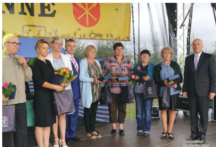
Wyróżnieni na Dożynkach Gminnych