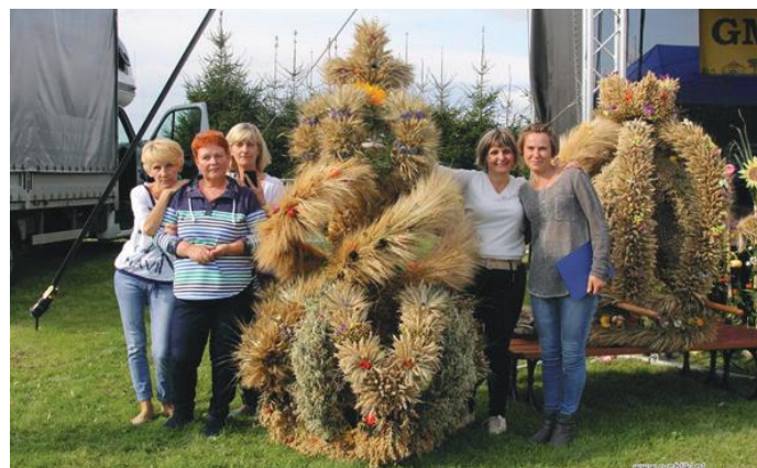
Autorki wieńca z Rychlik