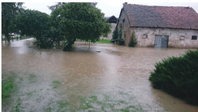
Podtopiona posesja w Jelonkach

70 litrów na metr kwadratowy – tyle wody 18-20 września spadło w naszej gminie. Takiej ilości nie były w stanie na bieżąco odprowadzić ani rowy, ani ciekły wodne. Doszło do szeregu podtopień posesji, piwnic budynków mieszkalnych, dróg. Straty w zasiewach i uprawach zgłosili rolnicy.