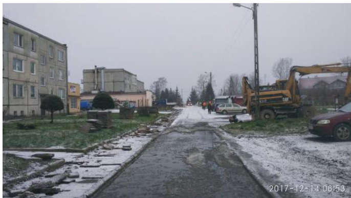
Prace drogowe na osiedlu „Podleśna”

Rozpoczęły się prace przebudowy drogi na osiedlu „Podleśna”. Obecnie są zdejmowane stare płyty z nawierzchni chodnika. Wykonawca do końca grudnia planuje wybudować kanalizację deszczową. Jeszcze więc w tym roku powinny skończyć się problemy ze stojącą wodą, a pojawiają się one po każdym nawet niedużym deszczu. Pozostałe prace będą wykonane przyszłym w roku. Zaplanowany termin realizacji