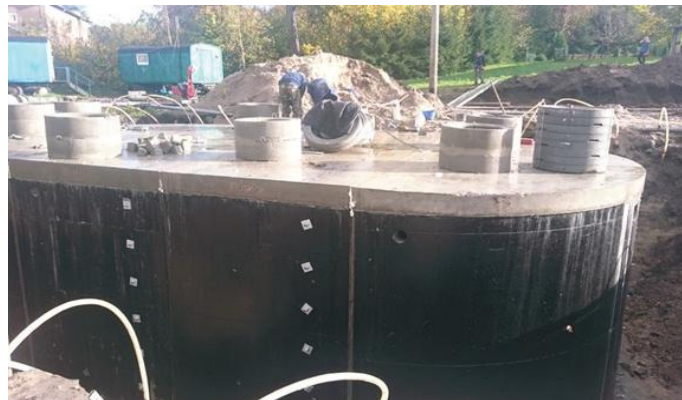
Montaż oczyszczalni