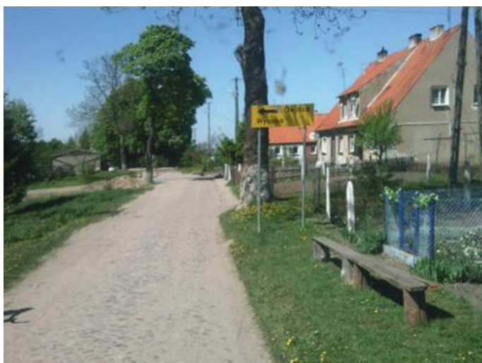
Brukowana droga w Powodowie

Nową nawierzchnię asfaltową, chodniki oraz odwodnienie w formie kanalizacji podziemnej zakłada projekt przebudowy drogi gminnej w Powodowie – na odcinku od drogi powiatowej do boiska oraz do odgałęzienia w stronę stawu. Dokumentacja ma być gotowa jeszcze w tym roku. Koszt projektu 30 tys. zł.