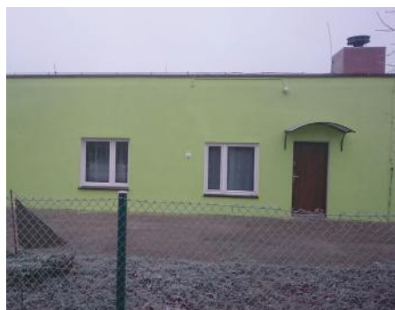
Świetlica w Wysokiej po remoncie

W listopadzie zakończył się remont elewacji budynku świetlicy wiejskiej w Wysokiej. Budynek zyskał estetyczny wygląd. Prace budowlane zostały wykonane za kwotę 9,7 tys. zł w ramach funduszu sołeckiego.