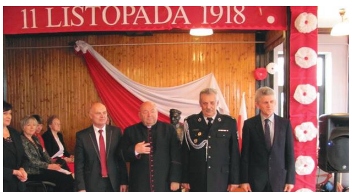
Wyróżnieni za krzewienie postaw patriotycznych