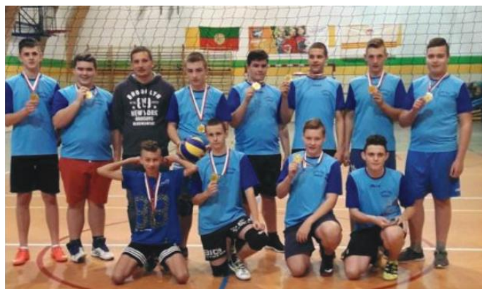
Zwycięski zespół SP Rychliki

W grudniu w Gronowie Elbląskim odbył się turniej finałowy powiatu elbląskiego w piłce siatkowej chłopców. Zespół z Rychlik wygrał