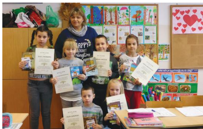
Dzieci nagrodzone w konkursie