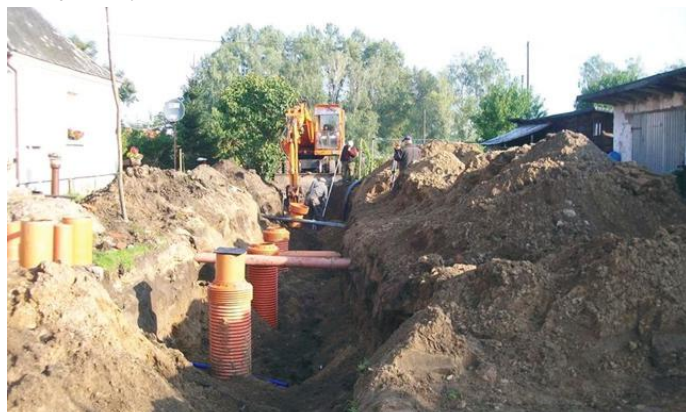
Budowa sieci wodociągowej i kanalizacyjnej w Rejsytach, fot. A. Kulma

– Była to bardzo trudna inwestycja, zwłaszcza proces przygotowania projektu, uzyskania pozwoleń. Trwało to długo. Duże wykopy i ciężki sprzęt we wsi były na pewno uciążliwe dla mieszkańców. Jednak samorząd musi zapewnić dostęp do czystej i bezpiecznej dla zdrowia wody – woda to życie. Cieszę się, że zrobiliśmy też kolejny krok naprzód w kierunku poprawy środowiska w gminie, budując kanalizację i kolejną oczyszczalnię ścieków.