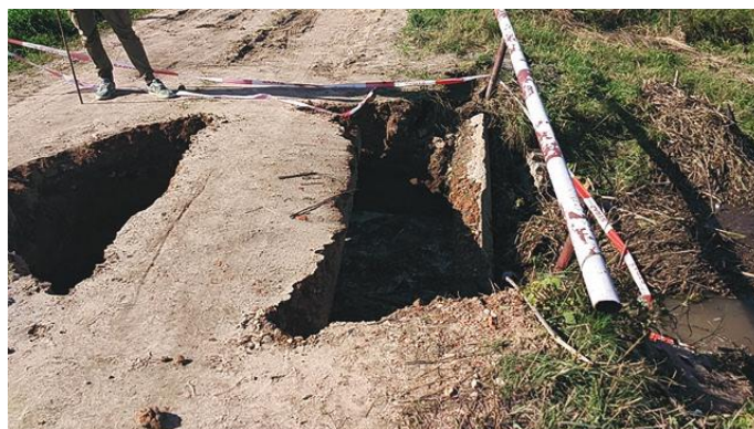
Wyrwa w drodze do Wopit

Ukończona jest prawie dokumentacja projektowa przebudowy tego przepustu. Jego wielkość ma zapewnić swobodny przepływ wody. Szacowany wstępnie koszt takiej inwestycji to 160 tys. zł.