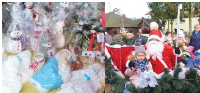
Kiermasz świąteczny

Na placu obok fontanny dzieci, rodzice i wychowawcy klas zorganizowali kiermasz świąteczny. Można było kupić bożonarodzeniowe dekoracje i smakołyki. Pomimo braku śniegu Mikołajowi udało się dotrzeć na saniach.